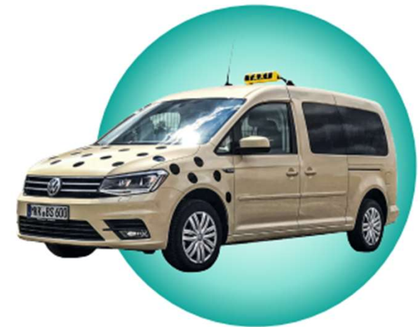
Bildnachweise: Titel: © RVMK, Taxi: © Taxi Boest